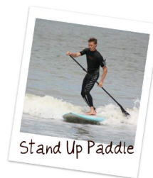
Stand Up Paddle