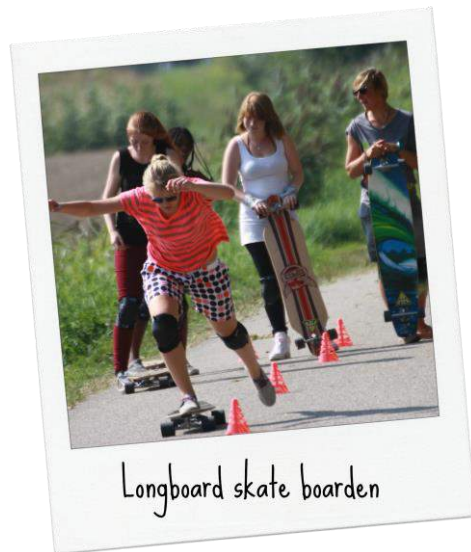
Longboard skate boarden